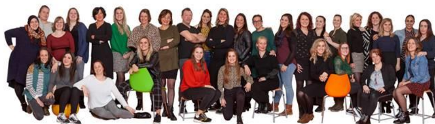
Kindercampus De Vuurvogel 2018-2019